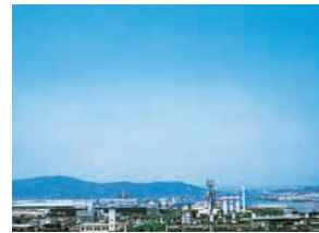
다시 찾은 파란 하늘(현재)