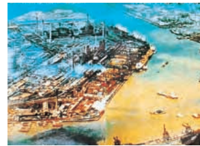
대장균조차 살 수 없던 오염된 도카이만(1960년대)