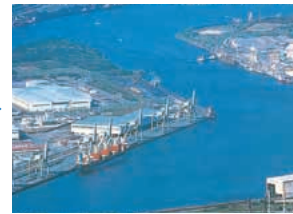
다시 깨끗해진 도카이만(현재)