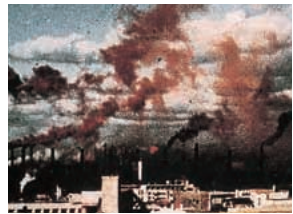
연기로 뒤덮인 하늘(1960년대)

시민, 기업, 행정기관의 협력 대응을 통해 환경은 급속하게 개선되었고, 1980년대에는 환경 재생에 성공한 기적의 도시로서 국내외에 소개되었습니다.